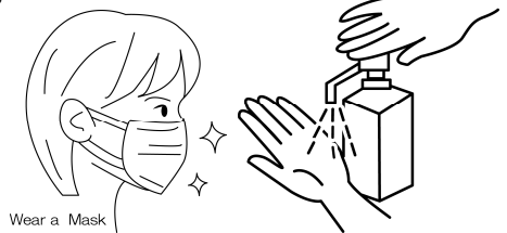
Wear a Mask

会場に入られる際には必ず 手指の消毒とマスクの着用 をお願いします。マスクはご持参ください。マスク未着用の方はご入館いただけません。